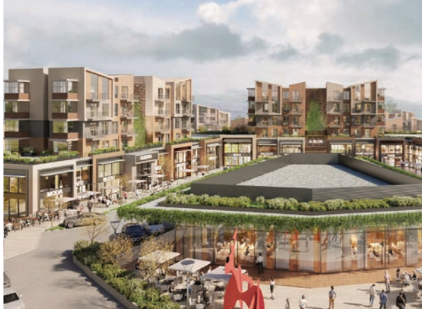
Proje İsmi : Nef Çekmeköy Şehir : İstanbul Yatırımcı : Timur Gayrimenkul Tarih : 2019