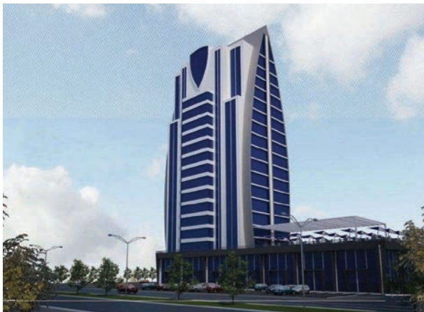
Proje İsmi : Gold N State Şehir : Ankara Yatırımcı : NFN İnşaat A.Ş. Tarih : 2017