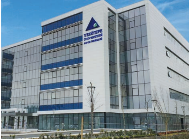
Proje İsmi : Yeditepe Üniversitesi Teknopark Ar-Ge ve Yönetim Binası Şehir : İstanbul Yatırımcı : Yeditepe Üniversitesi Tarih : 2018