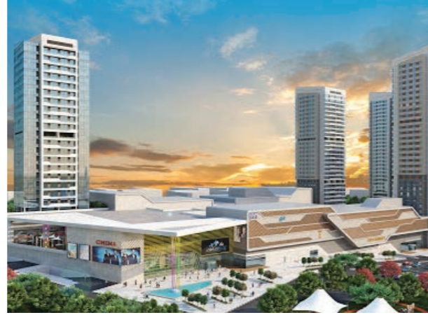
Proje İsmi : Metromall AVM Şehir : Ankara Yatırımcı : Söğüt İnşaat Tarih : 2016