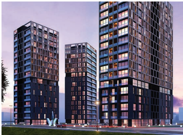
Proje İsmi : Dekon Suadiye Ametist Şehir : İstanbul Yatırımcı : Dekon İnşaat Tarih : 2016