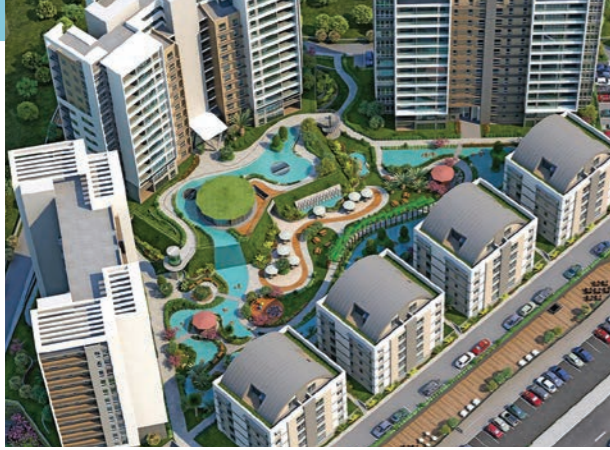
Proje İsmi : Seyran Şehir Şehir : İstanbul Yatırımcı : Emlak Konut GYO, Makro İnşaat, Akyapı Tarih : 2016