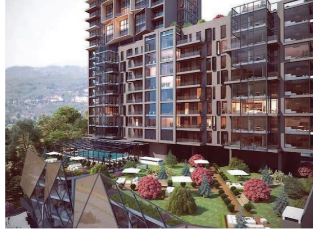
Proje İsmi : SO Yapı Residence Şehir : Ankara Yatırımcı : So Yapı Tarih : 2019