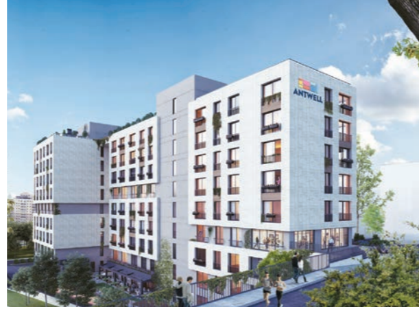
Proje İsmi : Antwell Şehir : İstanbul Yatırımcı : Ant Yapı Tarih : 2019