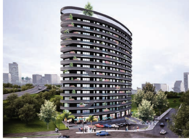
Proje İsmi : Parima Merter Şehir : İstanbul Yatırımcı : Fer Yapı Tarih : 2015