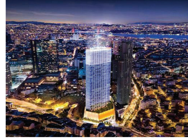
Proje İsmi : Queen Central Park Şehir : İstanbul Yatırımcı : Sinpaş GYO Tarih : 2017