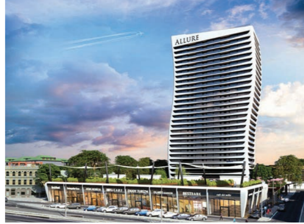
Proje İsmi : Allure Tower Şehir : İstanbul Yatırımcı : Doruk GYO Tarih : 2016