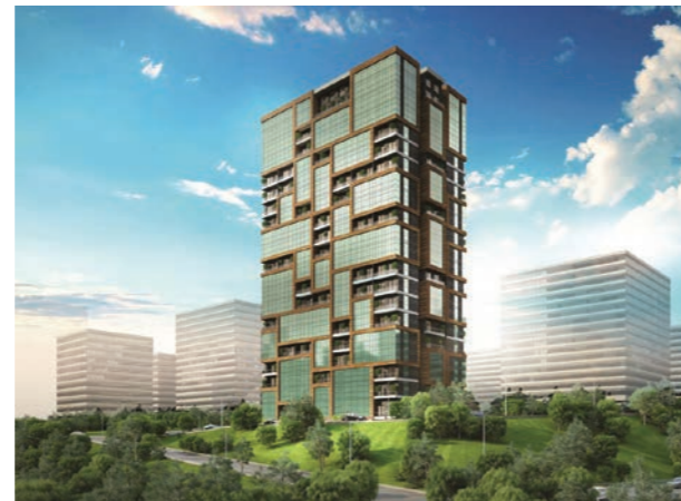
Proje İsmi : Alya Life Residence Şehir : İstanbul Yatırımcı : Ekşioğlu Yapı Tarih : 2017