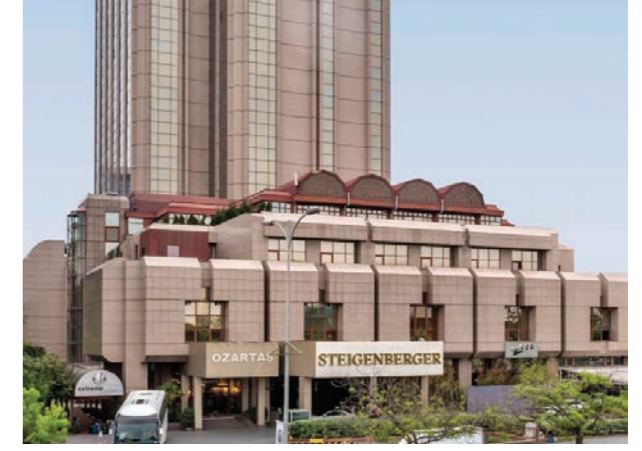
Proje İsmi : Maslak Hilton Otel Şehir : İstanbul Yatırımcı : Summa İnşaat Tarih : 2017