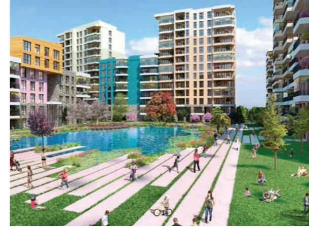
Proje İsmi : Aydos Country Şehir : İstanbul Yatırımcı : Sinpaş GYO Tarih : 2016