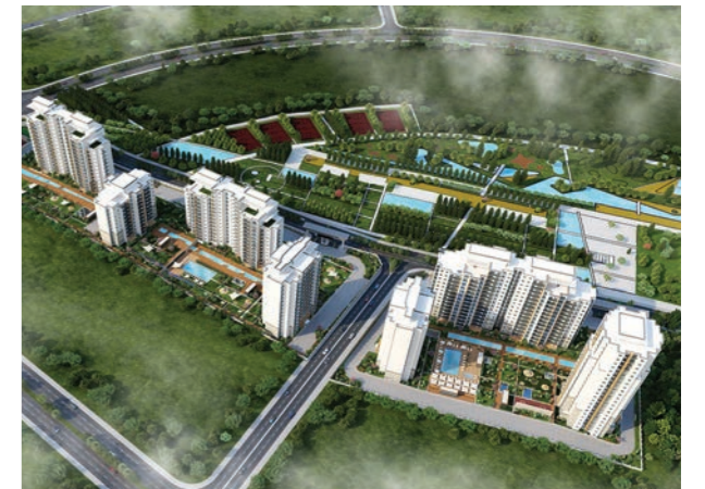
Proje İsmi : Bahçekent Flora Şehir : İstanbul Yatırımcı : Emlak Konut GYO, İzka İnşaat, Dağ Mühendislik, Sitar İnşaat Tarih : 2016