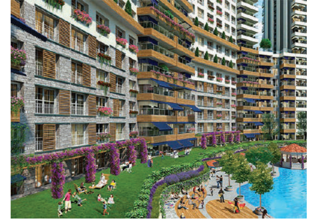
Proje İsmi : Ege Vadisi Şehir : Ankara Yatırımcı : Sinpaş GYO Tarih : 2017