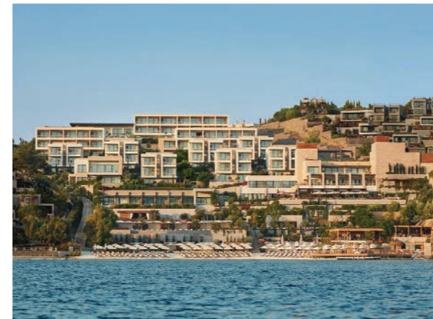
Proje İsmi : The Bodrum Edition - Marriott International Şehir : Bodrum Yatırımcı : Rönesans Holding Tarih : 2015