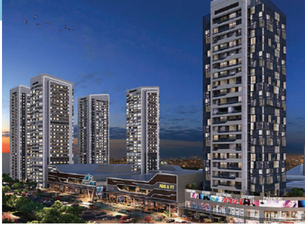
Proje İsmi : MetroMall Şehir : Ankara Yatırımcı : Söğüt İnşaat Tarih : 2016