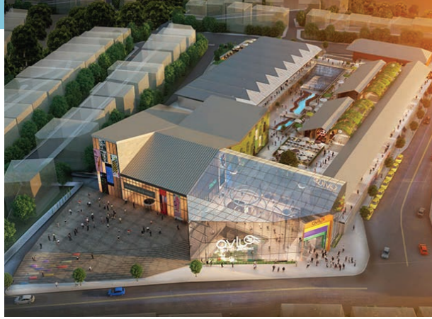
Proje İsmi : Avlu34 AVM Şehir : İstanbul Yatırımcı : Tema Teknik Gayrimenkul Tarih : 2018