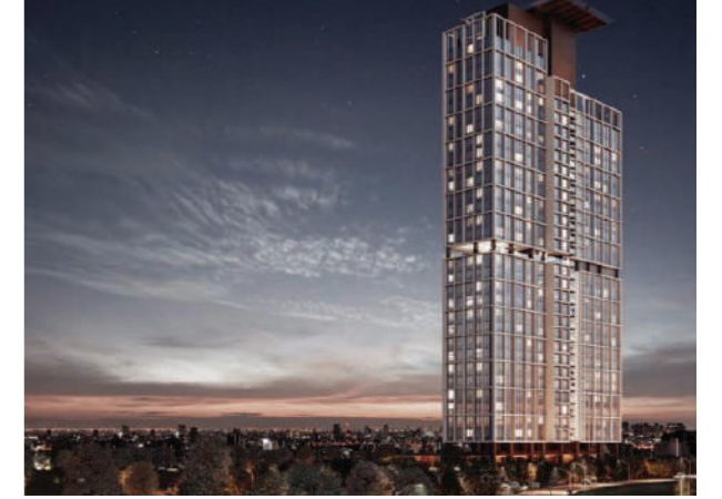
Proje İsmi : Konum Beytepe Şehir : Ankara Yatırımcı : Tarmac Agrega Madencilik ve Yapı Tarih : 2019