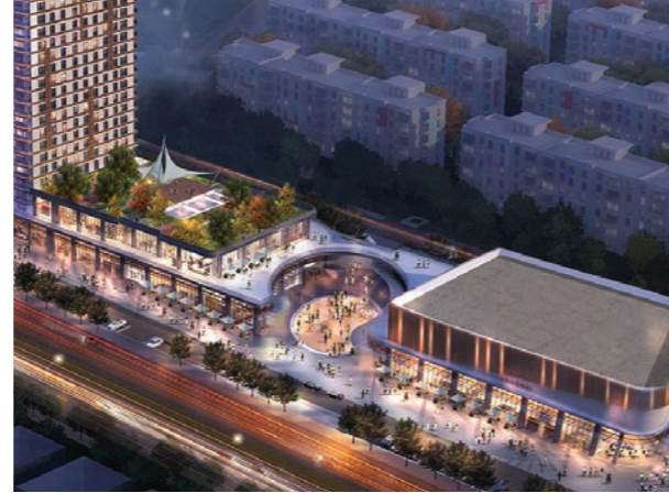
Proje İsmi : Beker Plaza Şehir : Ankara Yatırımcı : Beker Grup Tarih : 2017