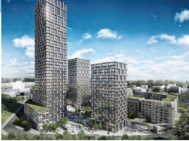
Proje İsmi : AND Pastel Şehir : İstanbul Yatırımcı : AND Gayrimenkul Tarih : 2017