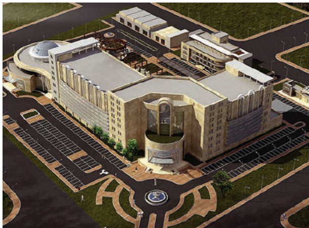
Proje İsmi : Rania 290 Yataklı Devlet Hastanesi Şehir : Süleymaniye, Kuzey Irak Yatırımcı : Kur İnşaat, İntaş İnşaat, Miran İnşaat Tarih : 2015