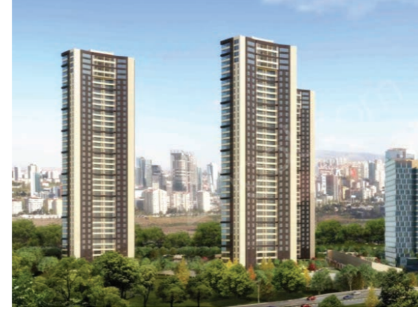
Proje İsmi : YDA Söğütözü Konut Şehir : Ankara Yatırımcı : YDA Grup, Bor-Tor İnşaat Tarih : 2018