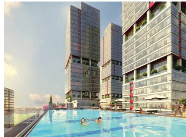
Proje İsmi : Dumankaya Ritim Şehir : İstanbul Yatırımcı : Dumankaya İnşaat Tarih : 2015