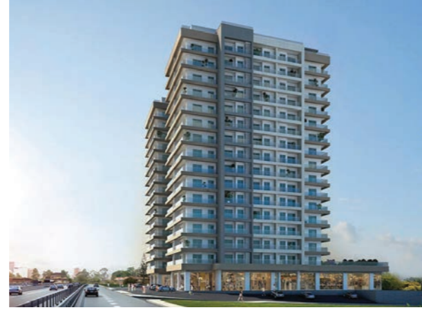
Proje İsmi : Route İstanbul Şehir : İstanbul Yatırımcı : Özyazıcı İnşaat Tarih : 2017