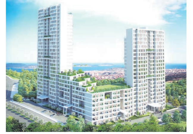
Proje İsmi : Rönesans Sayfiye Şehir : İstanbul Yatırımcı : Rönesans Holding Tarih : 2015