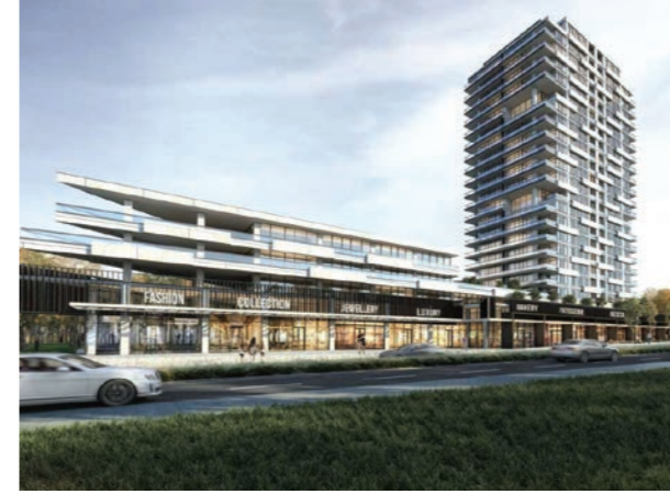
Proje İsmi : Avend Çayyolu Şehir : Ankara Yatırımcı : Rast İnşaat Tarih : 2019