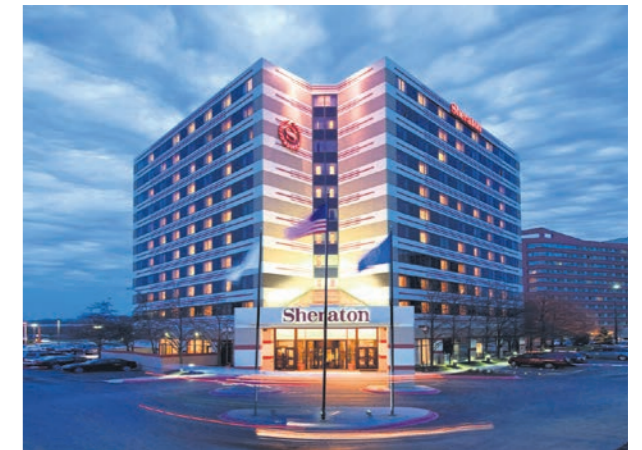
Proje İsmi : Sheraton Abuja Otel Şehir : Abuja, Nijerya Yatırımcı : Rönesans Holding Tarih : 2015