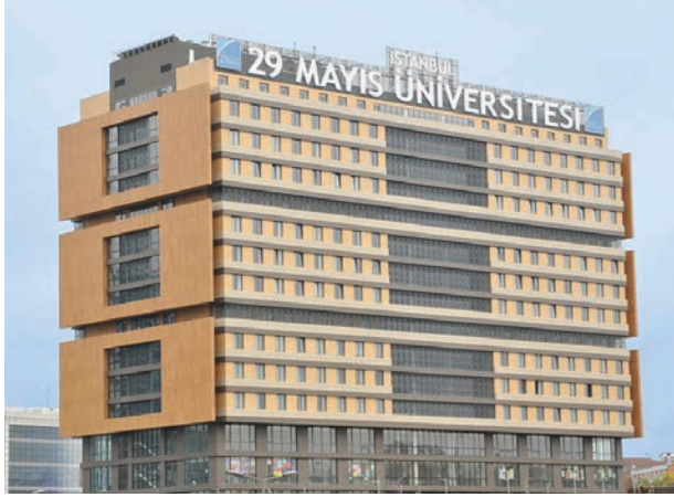
Proje İsmi : 29 Mayıs Üniversitesi Kız Öğrenci Yurdu Şehir : İstanbul Yatırımcı : 29 Mayıs Üniversitesi Tarih : 2015