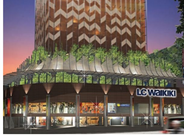
Proje İsmi : Malatya LCW Şehir : Malatya Yatırımcı : LCW Tarih : 2018