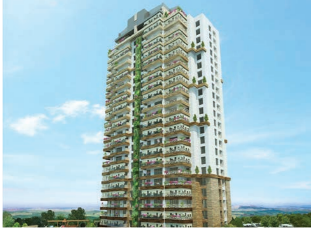
Proje İsmi : İncek Green Şehir : İstanbul Yatırımcı : Sinpaş GYO Tarih : 2016