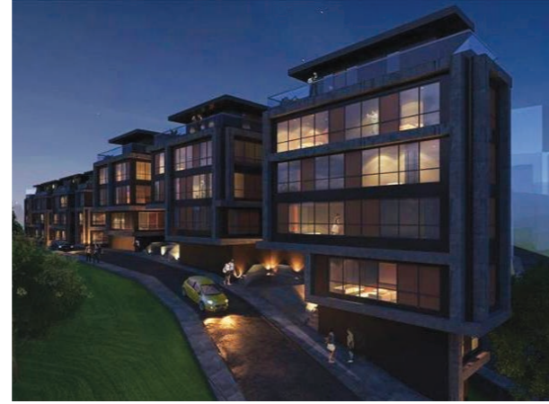
Proje İsmi : Nef 25B Şehir : İstanbul Yatırımcı : Nef İnşaat Tarih : 2017