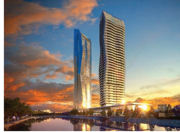
Proje İsmi : Mistral İzmir Şehir : İzmir Yatırımcı : Miray İnşaat Tarih : 2015