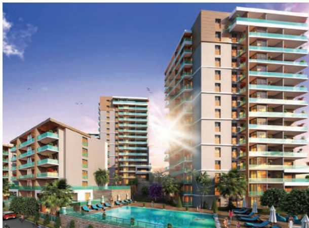
Proje İsmi : Park Yaşam Santorini Şehir : İzmir Yatırımcı : İzka İnşaat Tarih : 2019