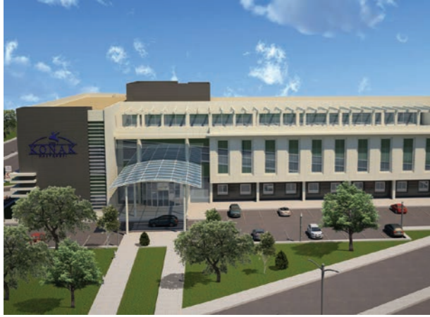
Proje İsmi : Özel Konak Sakarya Hastanesi Şehir : Sakarya Yatırımcı : Konak Sağlık Grubu Tarih : 2016