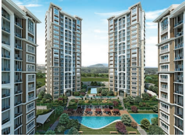
Proje İsmi : Sofa Loca Şehir : Ankara Yatırımcı : Emlak Konut GYO, Baş Yapı, Solar Yapı Tarih : 2016