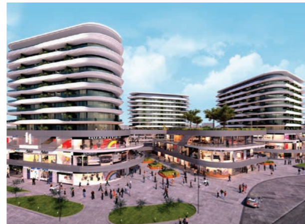
Proje İsmi : Real Merter Şehir : İstanbul Yatırımcı : Oliv Yapı, Vizyon Art Yapı Tarih : 2016