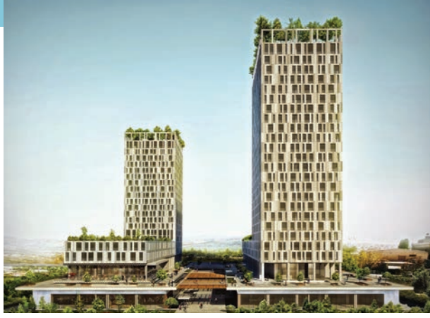
Proje İsmi : Divan Residence G Plus Şehir : İstanbul Yatırımcı : Mar Yapı Tarih : 2015