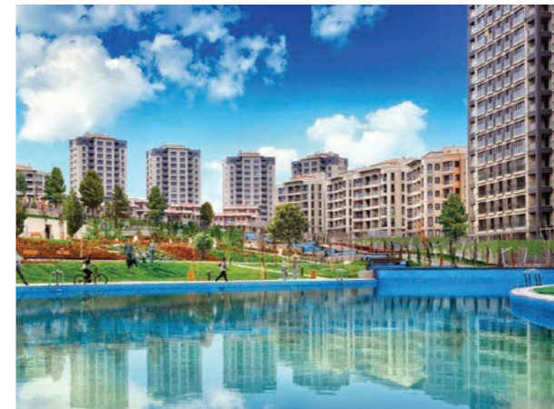
Proje İsmi : İncek Life Şehir : Ankara Yatırımcı : Sinpaş GYO Tarih : 2016