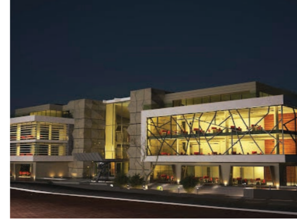
Proje İsmi : Denizciler İş Merkezi Şehir : İstanbul Yatırımcı : Deniz Nakliyat Tarih : 2016