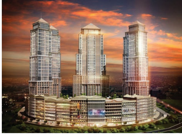
Proje İsmi : Viaport Venezia Şehir : İstanbul Yatırımcı : Bayraktar İnşaat, Gür Yapı Tarih : 2015