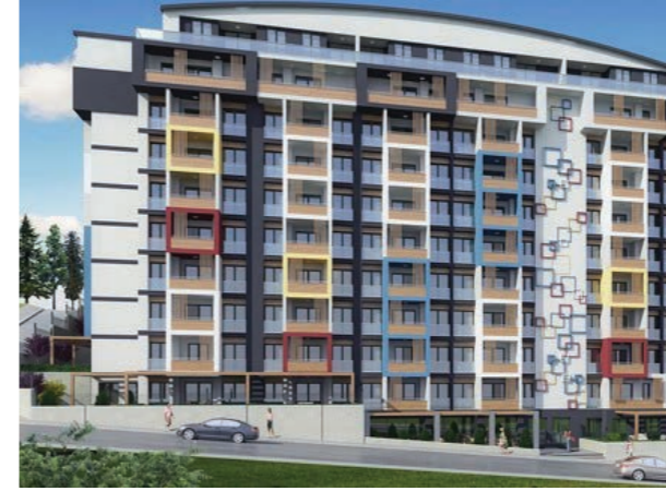
Proje İsmi : Yalçınlar Yaşam Görükle Şehir : Bursa Yatırımcı : Turumtaş İnşaat Tarih : 2017