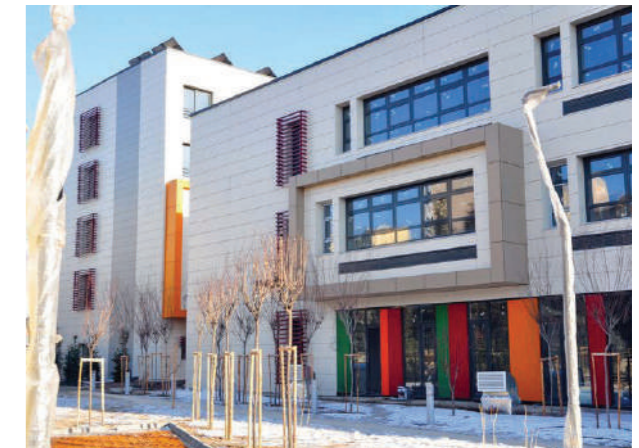
Proje İsmi : Cezeri Yeşil Teknoloji Mesleki ve Teknik Anadolu Lisesi Şehir : Ankara Yatırımcı : T.C. Milli Eğitim Bakanlığı Tarih : 2016