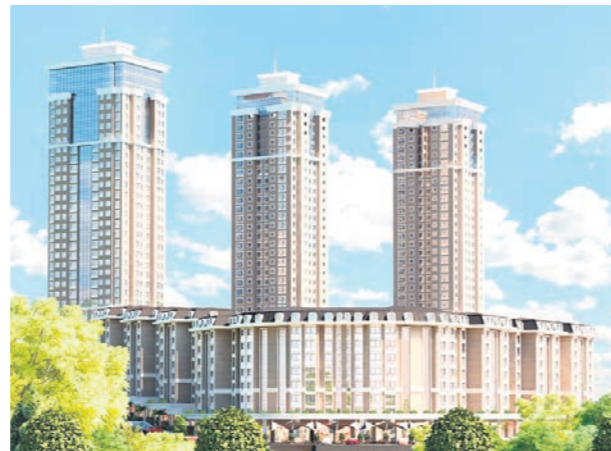
Proje İsmi : Trendist Ataşehir Şehir : İstanbul Yatırımcı : Solid İnşaat, K Yapı Tarih : 2015