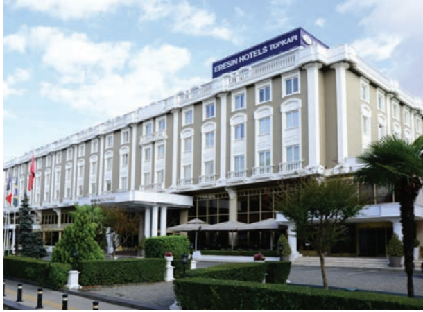
Proje İsmi : Topkapı Eresin Otel Şehir : İstanbul Yatırımcı : Eresin Grup Tarih : 2019