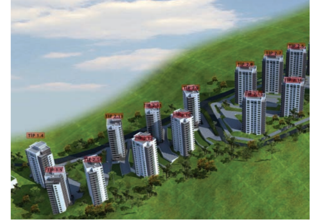
Proje İsmi : TOKİ Gölbaşı İncek Konutları Şehir : Ankara Yatırımcı : YDA İnşaat ve Yüksel İnşaat Konsorsiyumu Tarih : 2016