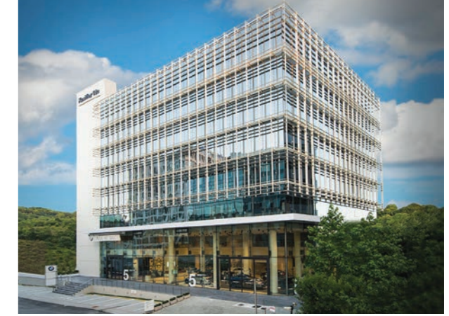
Proje İsmi : Kosifler Kavack Ofis Şehir : İstanbul Yatırımcı : Kosifler İnşaat Tarih : 2016