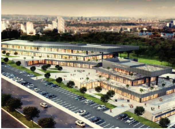
Proje İsmi : Kaşmir Center Şehir : Ankara Yatırımcı : Kaşmir Yapı Tarih : 2017