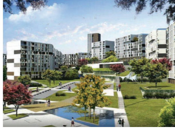
Proje İsmi : Başakşehir Evleri Şehir : İstanbul Yatırımcı : Emlak Konut GYO, Türkerler İnşaat Tarih : 2015