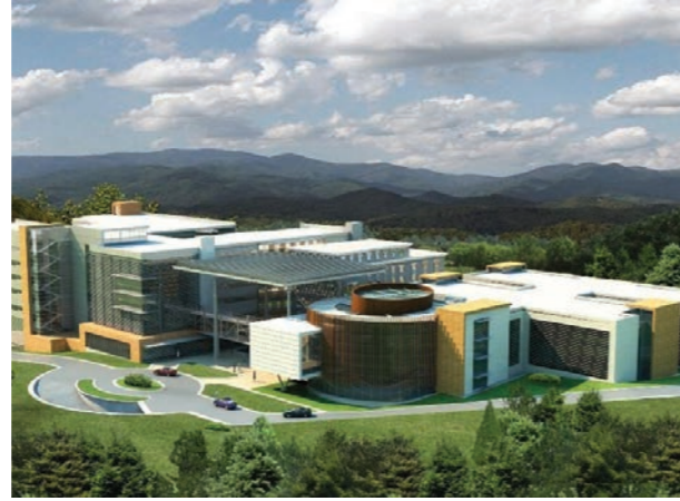
Proje İsmi : Sarıyer Eğitim ve Araştırma Hastanesi Şehir : İstanbul Yatırımcı : T.C. Sağlık Bakanlığı, YDA İnşaat Tarih : 2015