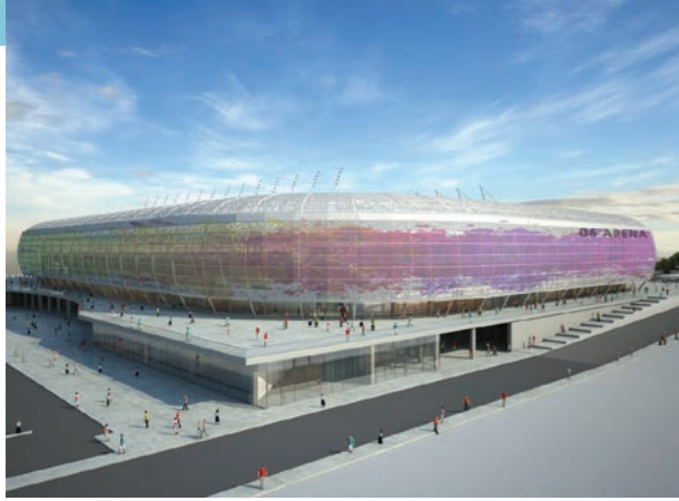
Proje İsmi : Eryaman Stadyumu Şehir : Ankara Yatırımcı : T.C. Gençlik ve Spor Bakanlığı Tarih : 2018