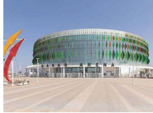
Proje İsmi : Senegal Dakar Arena Şehir : Senegal Yatırımcı : Summa İnşaat Tarih : 2017