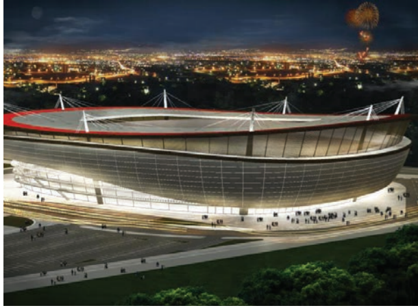
Proje İsmi : Eskişehir Stadyumu Şehir : Eskişehir Yatırımcı : T.C. Gençlik ve Spor Bakanlığı Tarih : 2015