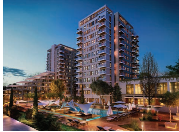
Proje İsmi : Nef Sancaktepe Şehir : İstanbul Yatırımcı : Timur Gayrimenkul Tarih : 2019