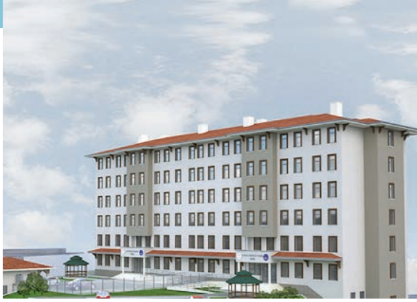
Proje İsmi : Rize Ardeşen 300 Kişilik Yurt Şehir : Rize Yatırımcı : Kredi ve Yurtlar Kurumu Tarih : 2019