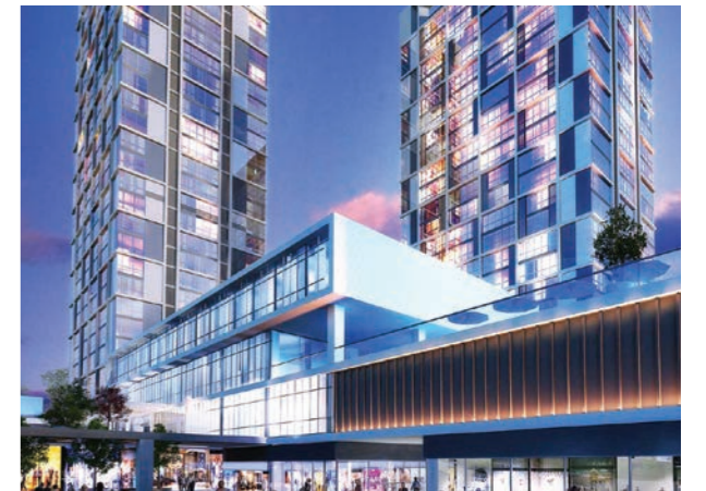
Proje İsmi : Dumankaya Miks Şehir : İstanbul Yatırımcı : Dumankaya İnşaat, Emlak Konut GYO Tarih : 2015