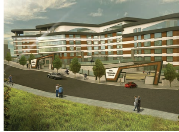
Proje İsmi : Yükselen Koleji Mamak Kampüsü Şehir : Ankara Yatırımcı : Yükselen Koleji Tarih : 2018