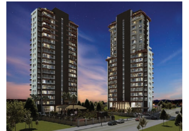
Proje İsmi : Emperia Dragos Şehir : İstanbul Yatırımcı : Ulusal Grup Tarih : 2018