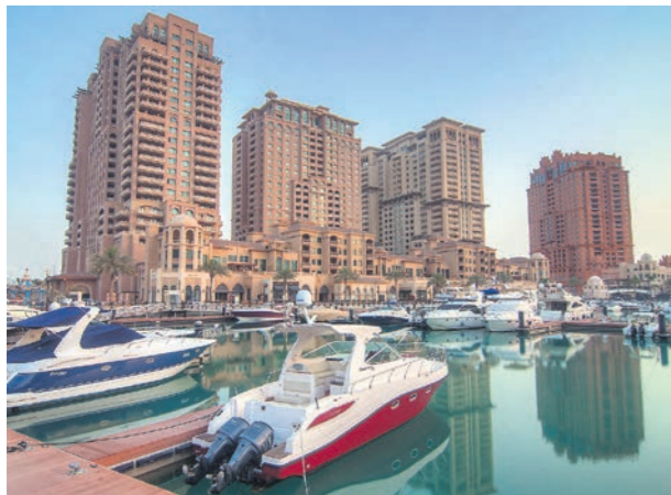
Proje İsmi : Porto Arabia Apartments Şehir : Doha, Katar Yatırımcı : United Development Company Tarih : 2015