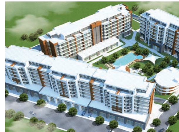
Proje İsmi : Tuzla Ambiyans Şehir : İstanbul Yatırımcı : Şahsuvaroğlu Grup Tarih : 2018