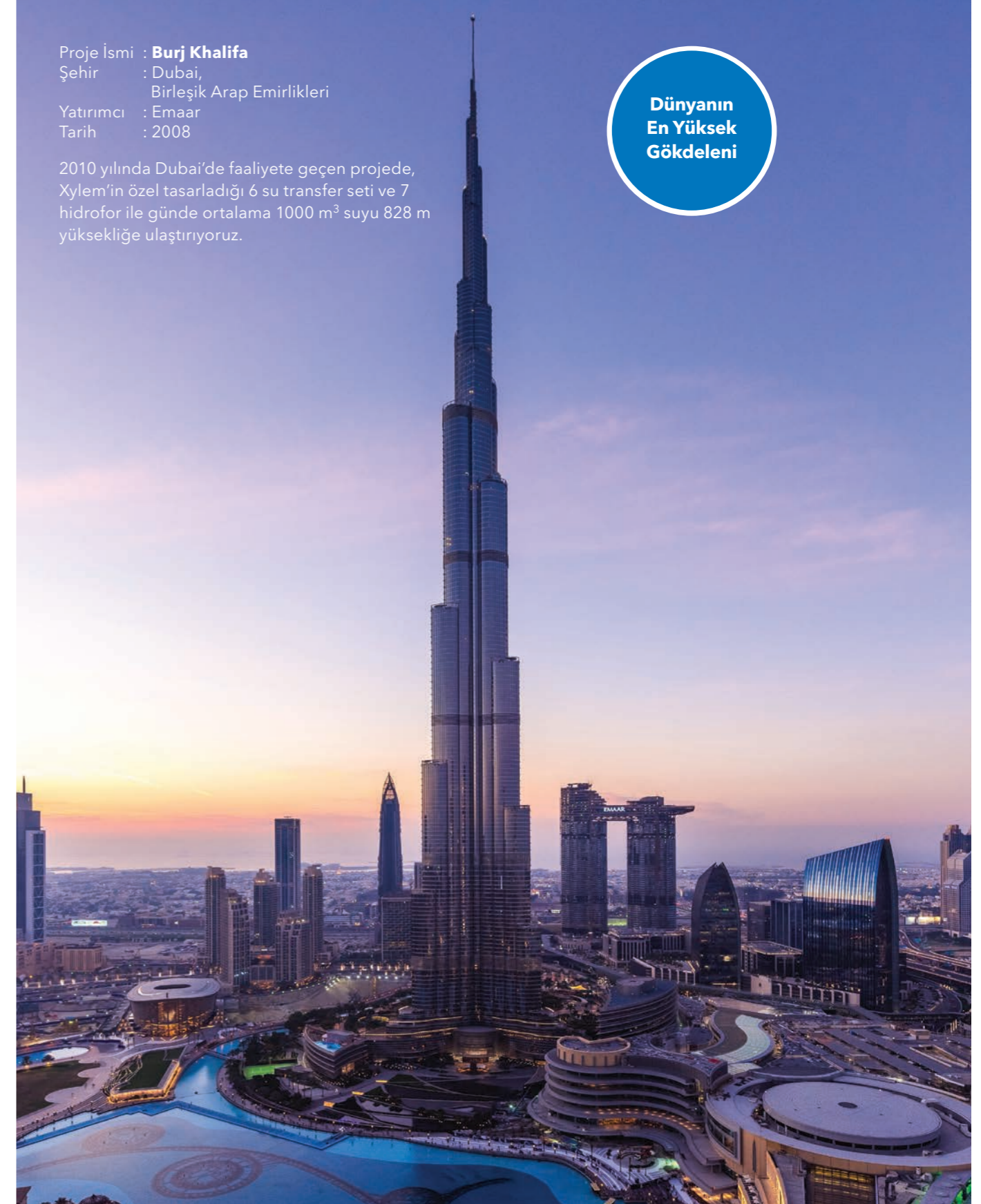
Proje İsmi : Burj Khalifa Şehir : Dubai, Birleşik Arap Emirlikleri Yatırımcı : Emaar Tarih : 2008

2010 yılında Dubai'de faaliyete geçen projede, Xylem'in özel tasarladığı 6 su transfer seti ve 7 hidrofor ile günde ortalama 1000 m 3 suyu 828 m yüksekliğe ulaştırıyoruz.