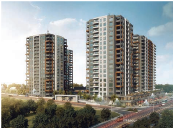
Proje İsmi : Hittown Şehir : Ankara Yatırımcı : Hit Yapı Tarih : 2019