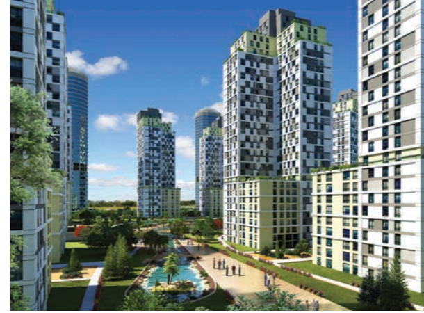
Proje İsmi : Kristal Şehir Şehir : İstanbul Yatırımcı : İhlas İnşaat A.Ş. Tarih : 2015