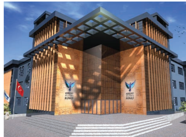
Proje İsmi : Kırdar Bilgiören Koleji Şehir : Kütahya Yatırımcı : Kırdar Grup Tarih : 2017