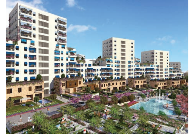
Proje İsmi : Ege Yakası Şehir : İstanbul Yatırımcı : Sinpaş GYO Tarih : 2016