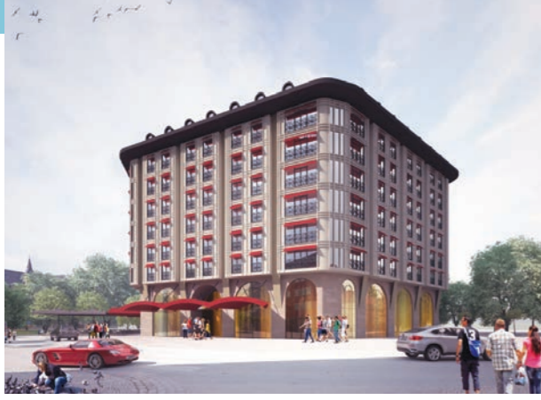
Proje İsmi : Merter Ibis Style Hotel Şehir : İstanbul Yatırımcı : Doğan Tekstil Tarih : 2020