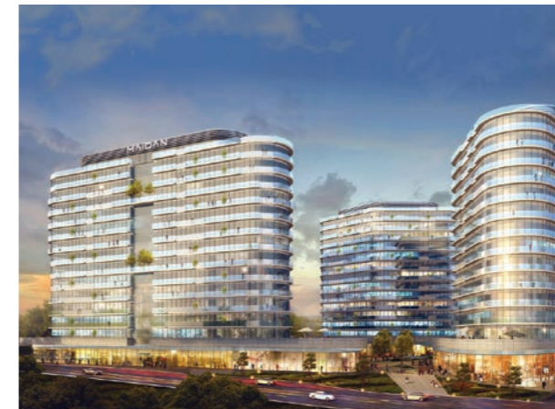
Proje İsmi : Maidan Residence Şehir : Ankara Yatırımcı : Ege Grup Yapı Endüstrisi A.Ş., BM Mühendislik ve İnşaat A.Ş. Tarih : 2016