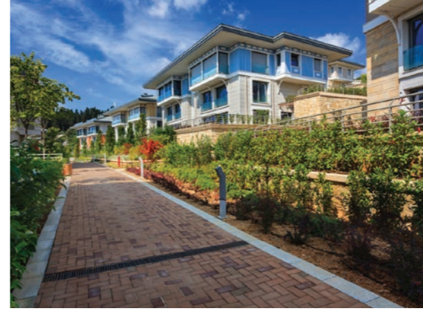
Proje İsmi : Antteras Şehir : İstanbul Yatırımcı : Ant Yapı Tarih : 2015