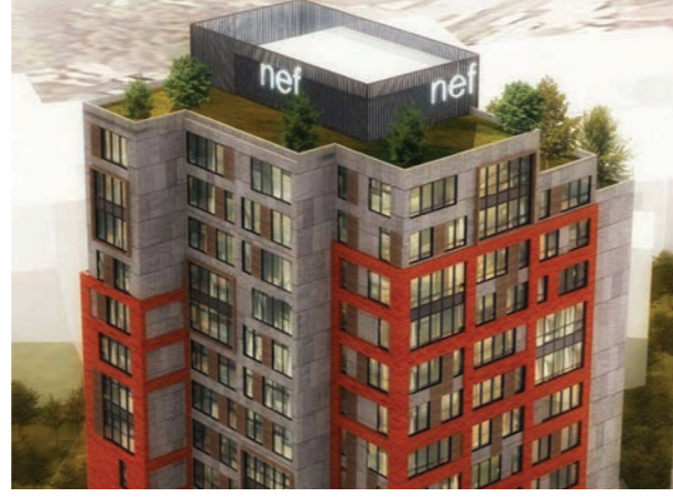
Proje İsmi : Nef 98 Şehir : İstanbul Yatırımcı : Timur Gayrimenkul Tarih : 2016