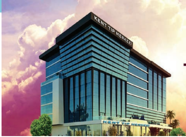
Proje İsmi : Kent Bayraklı Tıp Merkezi Şehir : İzmir Yatırımcı : Kent Sağlık Grubu Tarih : 2017