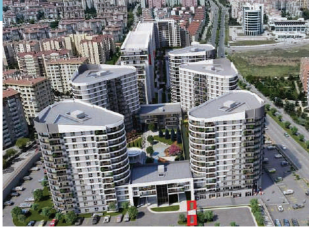
Proje İsmi : Gala Batikent Şehir : Ankara Yatırımcı : Kızıltoprak Gayrimenkul A.Ş. Tarih : 2019