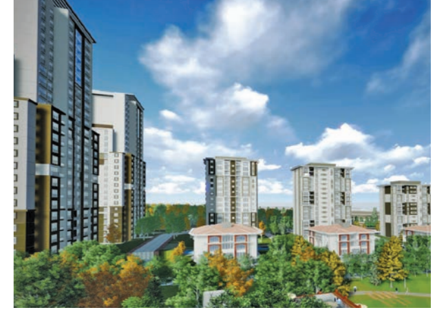
Proje İsmi : Bahçekent Emlak Konutları 1. ve 2. Etap Şehir : İstanbul Yatırımcı : Emlak Konut Gyo, Egemen İnşaat, İlgın İnşaat Tarih : 2015