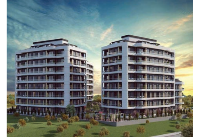
Proje İsmi : Avclar Mars19 Şehir : İstanbul Yatırımcı : Metraco A.Ş. Tarih : 2018