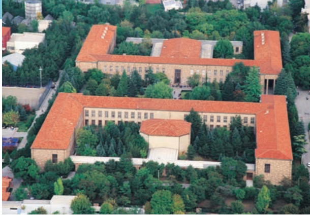
Proje İsmi : Ankara Üniversitesi Tandoğan Kampüsü Şehir : Ankara Yatırımcı : Ankara Üniversitesi Tarih : 2016