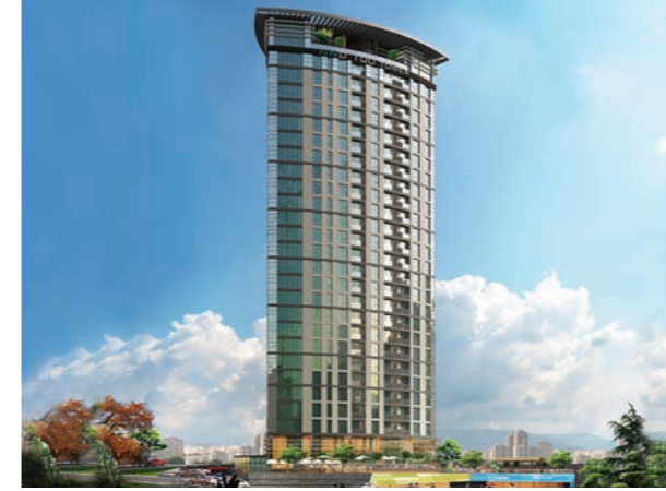
Proje İsmi : NND 100 Tower Şehir : İstanbul Yatırımcı : Nanda Yapı Tarih : 2016