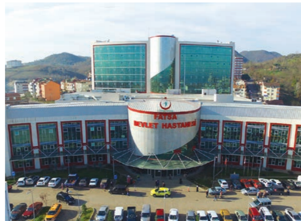
Proje İsmi : Fatsa Devlet Hastanesi Şehir : Ordu Yatırımcı : T.C. Sağlık Bakanlığı Tarih : 2015