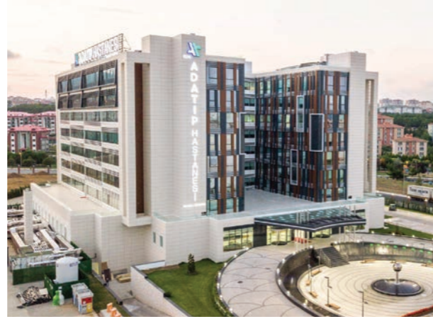
Proje İsmi : Özel Adatıp Hastanesi Şehir : İstanbul Yatırımcı : Adatıp Sağlık Grubu Tarih : 2016