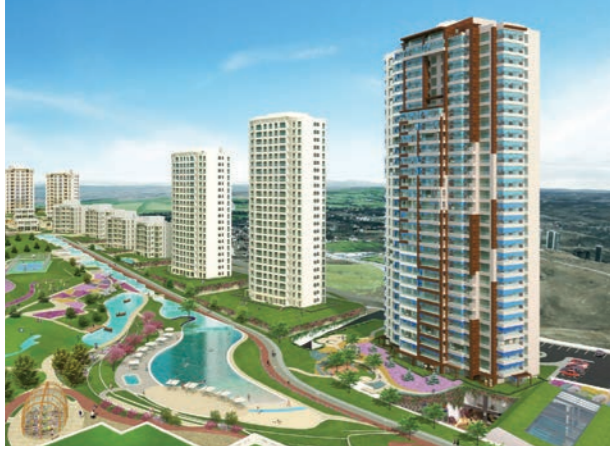
Proje İsmi : İncek Blue Şehir : Ankara Yatırımcı : Sinpaş GYO Tarih : 2015