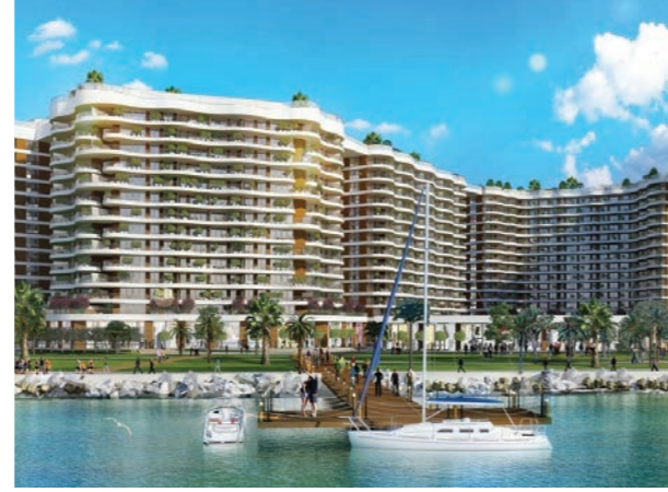
Proje İsmi : Blue Lake Küçükçekmece Şehir : İstanbul Yatırımcı : Metal Yapı, Karmen Yapı Tarih : 2016