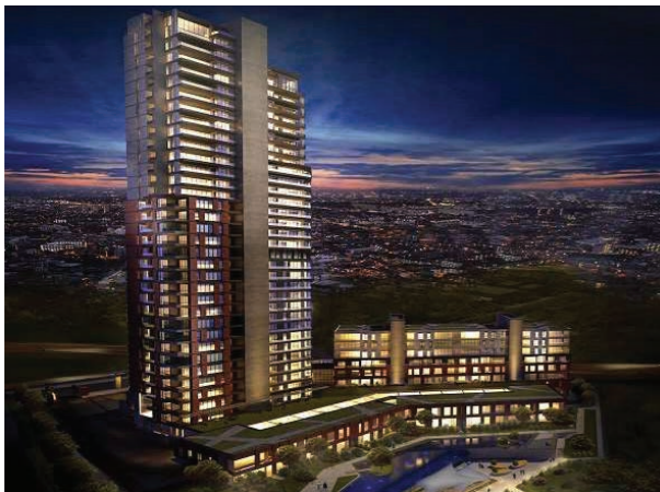
Proje İsmi : Elit Manzara Beytepe Şehir : Ankara Yatırımcı : Elit Yapı Tarih : 2017