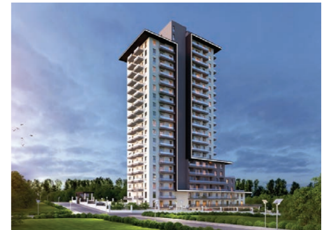
Proje İsmi : Mia Vita Konutları Beytepe Şehir : Ankara Yatırımcı : Anadolu Akaryakıt Tarih : 2016