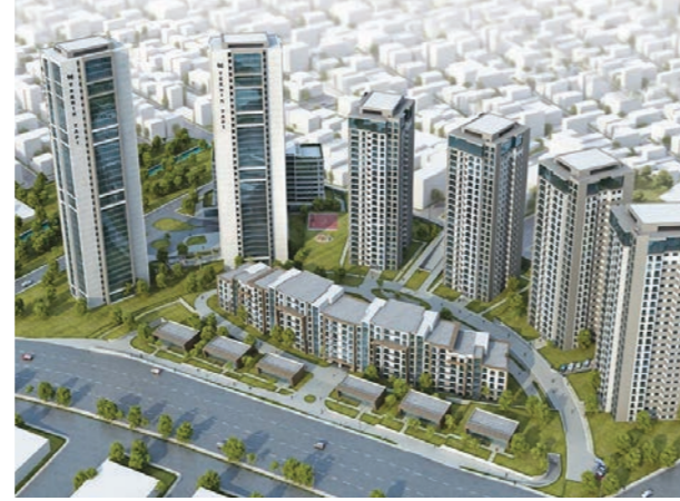
Proje İsmi : Metropark Şehir : İstanbul Yatırımcı : Teknik Yapı Tarih : 2015