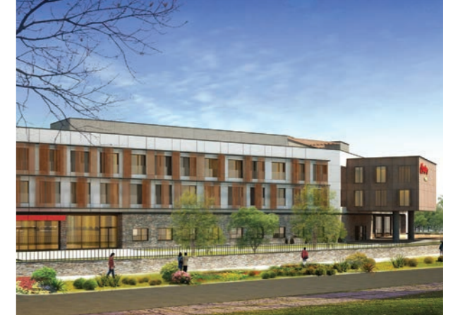
Proje İsmi : Hampton by Hilton İzmir Aliağa Şehir : İzmir Yatırımcı : Hilton Hotels & Resorts Tarih : 2016