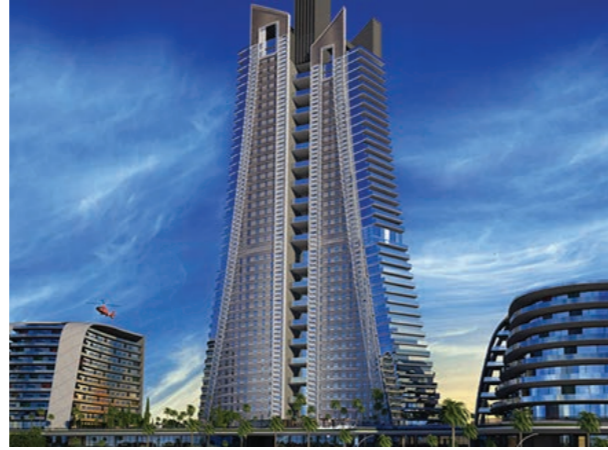
Proje İsmi : Sarphan Finanspark Şehir : İstanbul Yatırımcı : Emlak Konut GYO Tarih : 2015