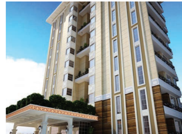
Proje İsmi : Pasha Loft Bilkent Şehir : Ankara Yatırımcı : Pasha Concept İnşaat Tarih : 2016